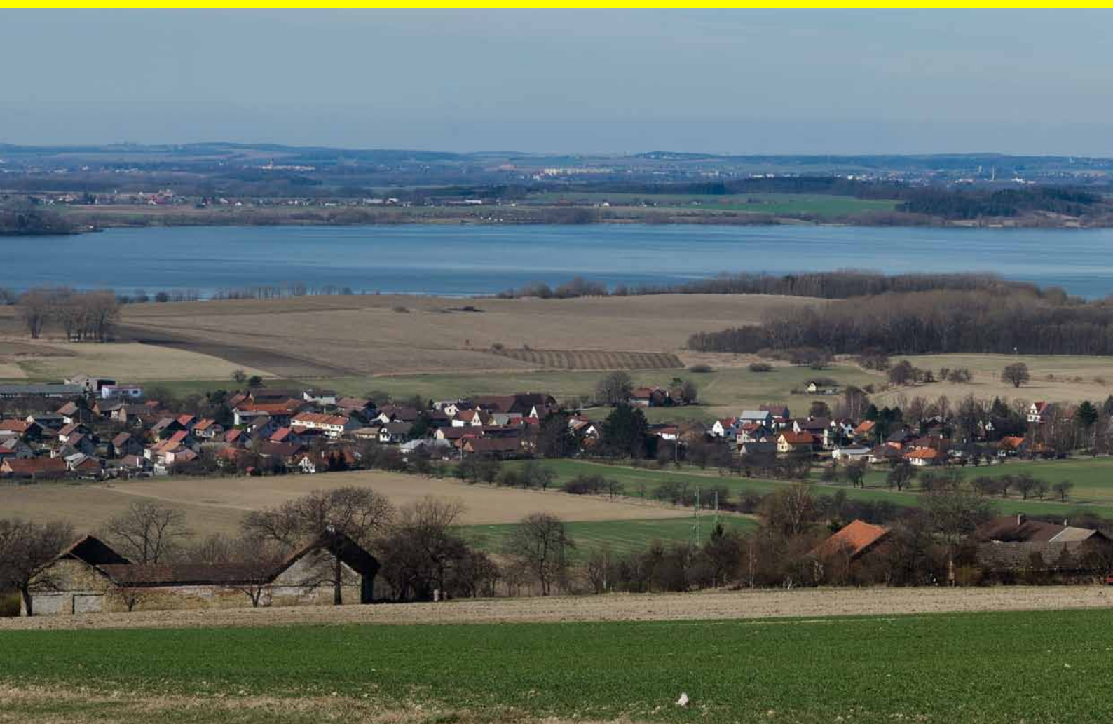
Pohled na přehradu Rozkoš, v pozadí Jaroměř a Josefov

ČLÁNKY - INFORMACE - AKTUALITY - NÁZORY- FOTOGRAFIE