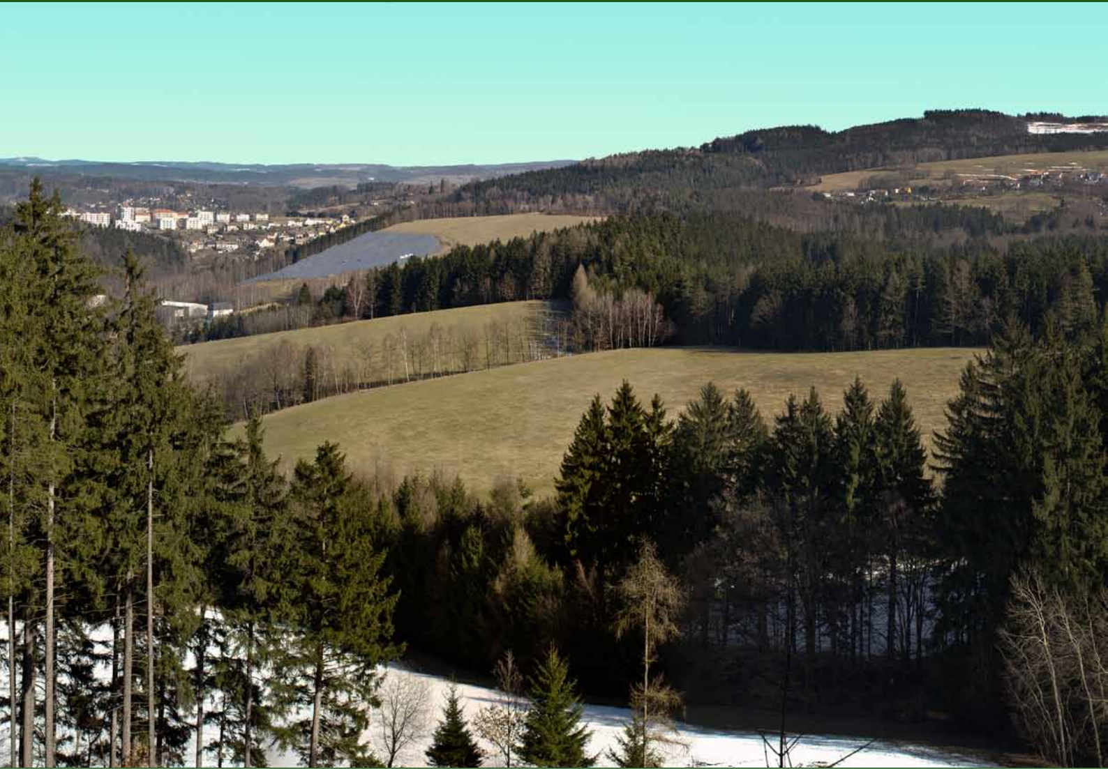
Pohled na Náchod od Vyhličky , v pozadí Krkonoše