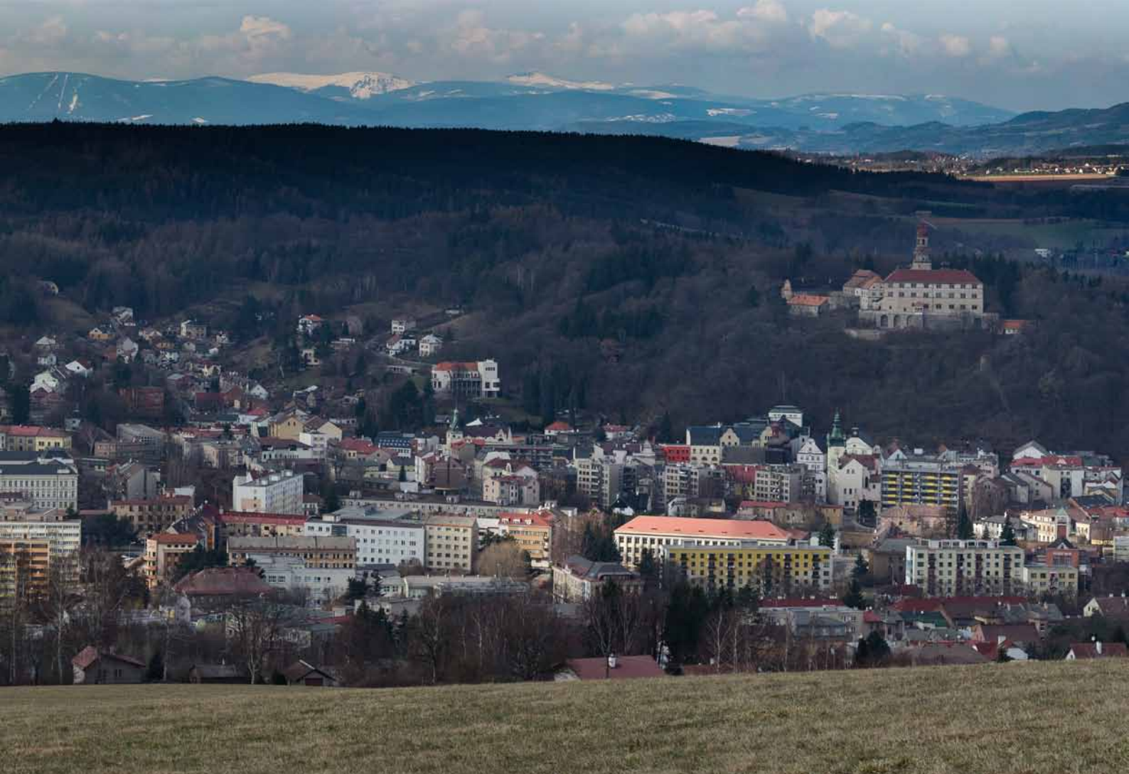
Pohled na Náchod přes louky za Bražcem, foto JB