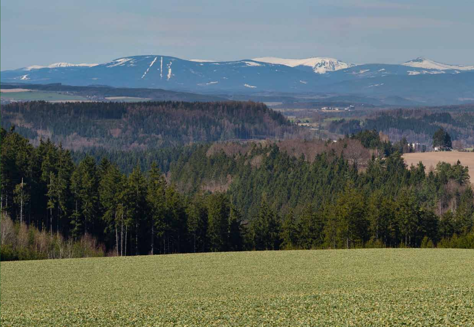
Pohled přes údolí Metuje na Krkonoše z Příbyslavi