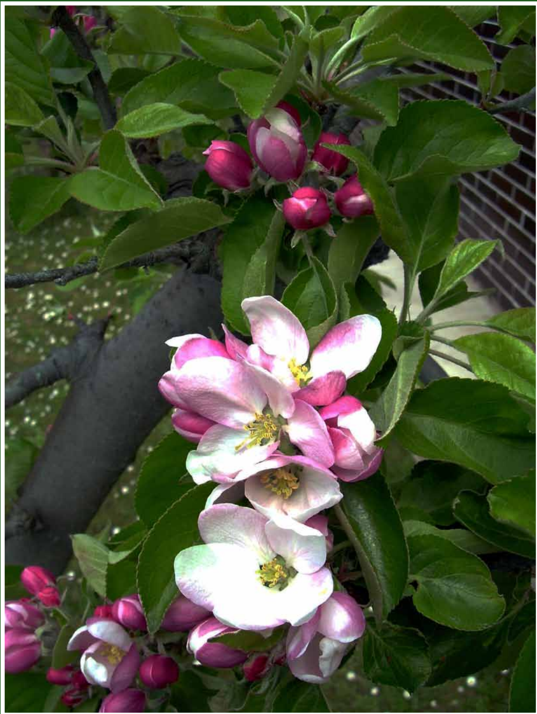
Jaro v plném rozpuku - nejlepší období roku, užijme si ho.