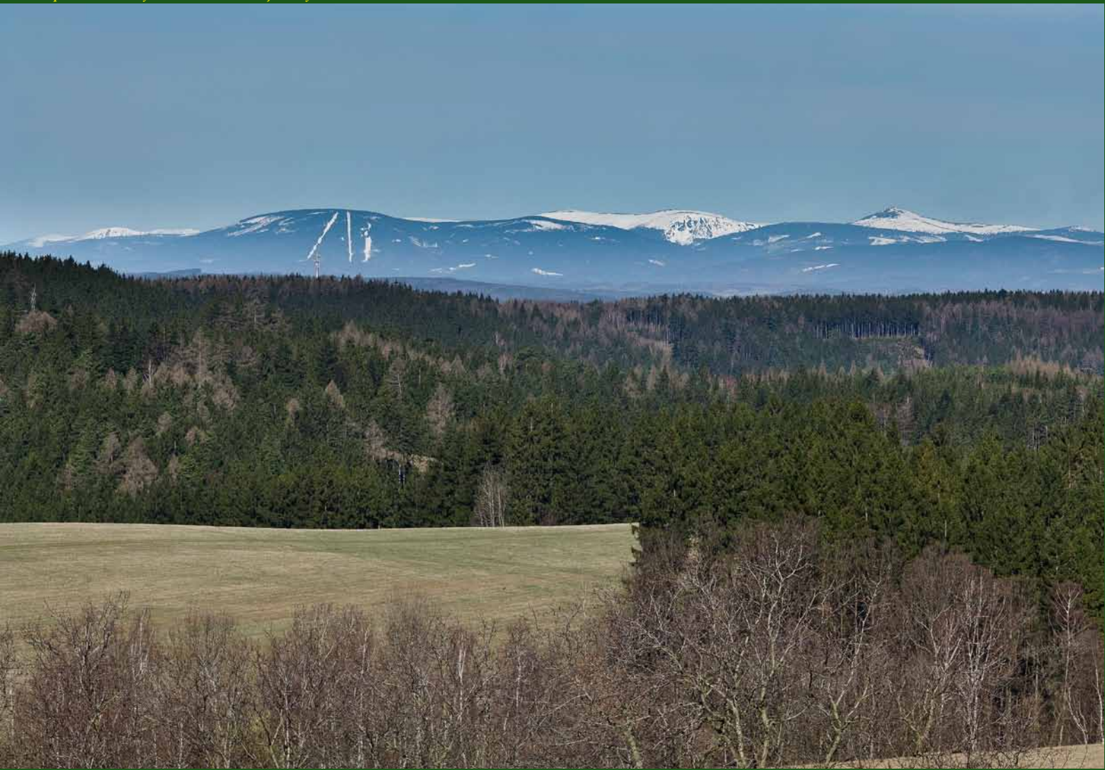
Pohled přes údolí Metuje na Krkonoše z Koničky.